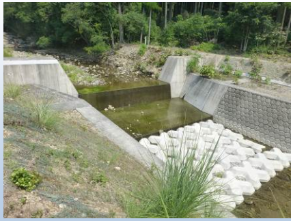
東九州自動車道 砂防床固工設計 (延岡市須美江町)