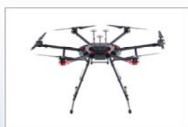
ドローンによる測量