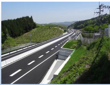
北方延岡道路 道路設計