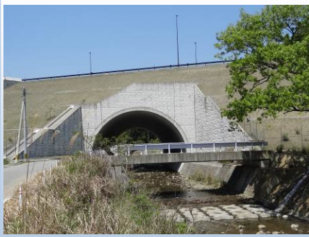
東九州自動車道 構造物設計